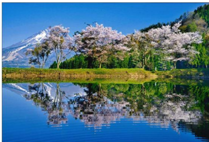
猪苗代湖・裏磐梯湖沼フォトコンテスト入賞作品