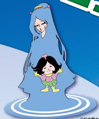
湖美来イメージキャラクター 湖春(こはる)&水恋(すいれん) ©松本零士