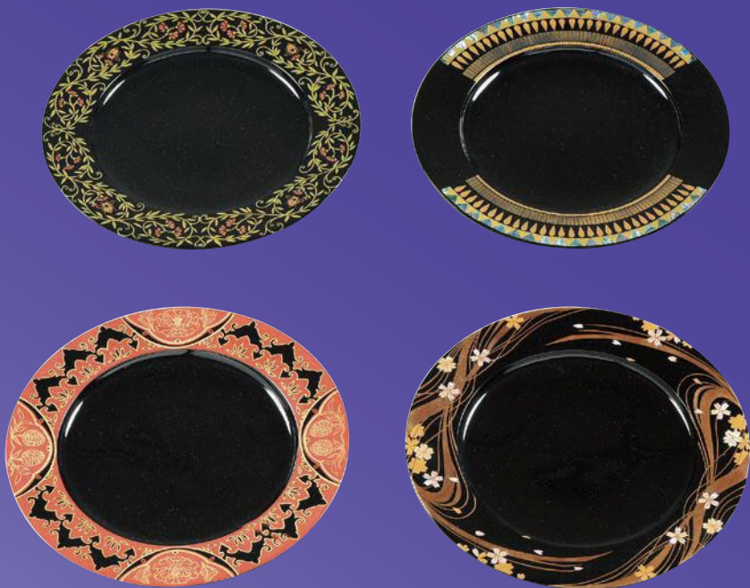
第75回県展 工芸美術の部 福島県美術大賞 蒔絵飾皿「世界美女」 幅 夏美

The 75th Fukushima Fine Arts Exhibition Aizu Special Exhibition