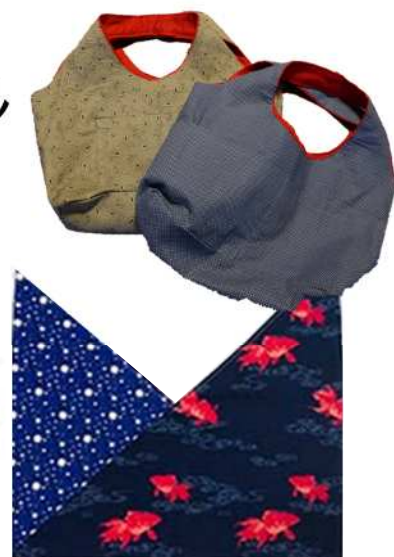
※エコバッグの一例