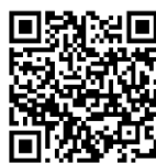
福島河川国道事務所 HP