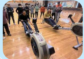
バーチャルローイング