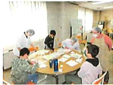
シュガークラフト体験