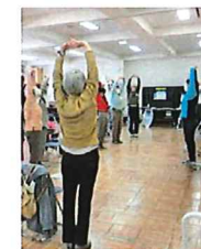
軽体操で体をほくほく！