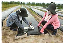
R5の移動学習の様子 ※R5年度は別の会場となります。