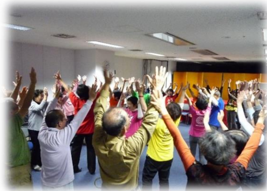
写真は、笑って健康教室のイメージです

教室の前後で身体測定、身体機能、血圧検査、体組成（筋肉量・骨量）、生活習慣アンケート等を受けていただきます。 検査の結果は教室終了後皆様にお返しし、笑いの効果を確認していただきます！