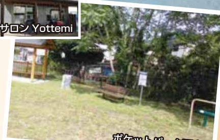
ポケットパーク西裏