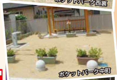
ポケットパーク中町