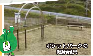
ポケットパークの健康器具