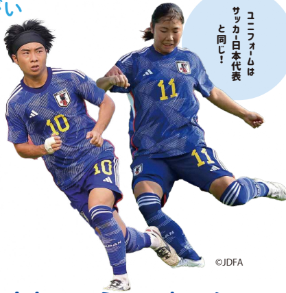
ユニフォームは サッカー日本代表 と同じ！

デフサッカーの基本ルールはきこえる人のサッカーと同じです。11人のチーム、45分ハーフで試合が行われ、ピッチの広さも同じです。ちがう点は、審判だけです。きこえる人のサッカーは副審だけがフラッグを使い、主審は笛のみを使いますが、デフサッカーは選手たちに主審の笛の音がきこえないため、主審もフラッグを使います。国際試合ではさらに両ゴールの後ろに1人ずつ、合計5人のフラッグを持った審判員が、プレーの停止を色々な方向から伝えます。