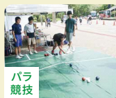
パラ 競技 ボッチャ ブラインドサッカー