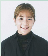
元サッカー日本女子代表 岩淵 真奈氏