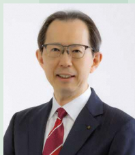
福島県知事 内堀 雅雄

「デフリンピックと言われても...きこえないとスポーツするのに困ることあるの?きこえない選手をどうやって応援すればいいの?デフリンピックって自分には関係ない?」そんな疑問を紐解きながら、きこえない人ときこえる人のトップアスリート、手話通訳士、知事、様々な立場で、1年後に福島県にやってくるデフリンピックをどう楽しむか、デフリンピックによってどんな福島県になるか考えます。