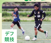
デフ 競技 デフサッカー デフ卓球