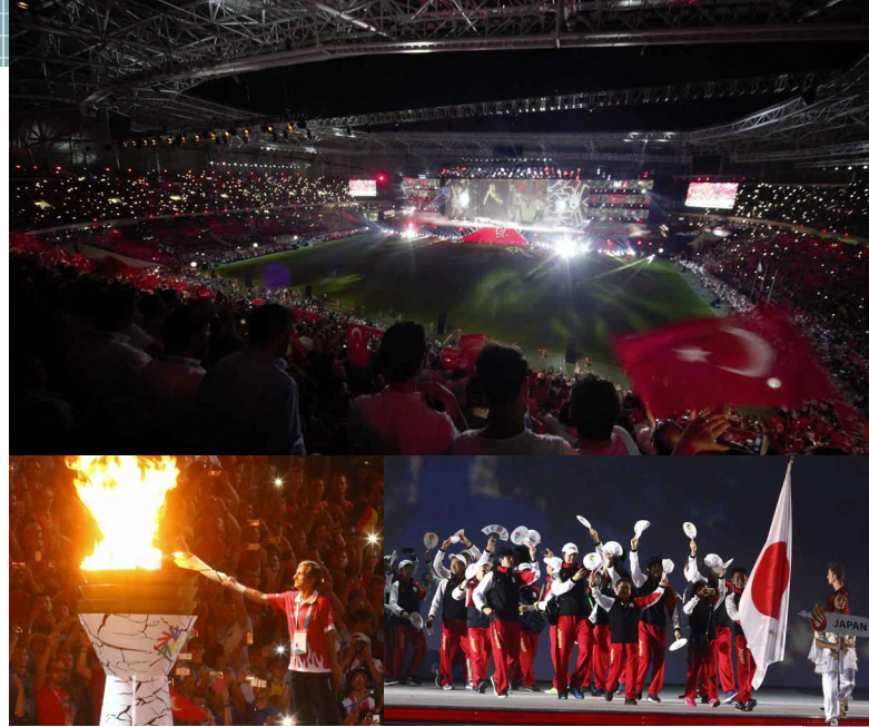
第23回夏季デフリンピックサムスン2017 2017年7月18日から30日 トルコ・サムスン市で開催 (一財)全日本ろうあ連盟

障がい者のスポーツ競技大会として知られるパラリンピックは、戦争で身体に障がいを負った兵士のリハビリテーションを目的として始まったことから、聴覚障がい者の競技種目は含まれていません。デフリンピックの歴史は1948年に始まったパラリンピックよりも古く1924年に始まりました。日本で初めて開催される「東京2025デフリンピック」は開催100周年の記念となる大会です。