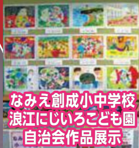
なみえ創成小中学校 浪江にじいるこども園 自治会作品展