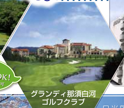
グランディ那須白河 ゴルフクラブ