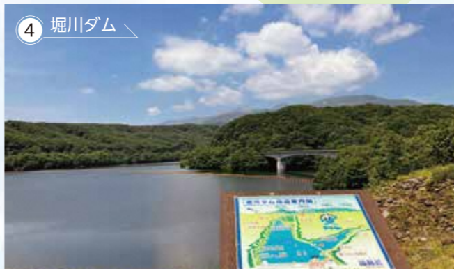
4 堀川ダム 日光国立公園に隣接する堀川ダムは、阿武隈川水系の堀川にあるダムで、平成12年に竣工しました。自然石を積み上げたロックフィルダムで、ダム湖である「まぶね湖」には、那須連峰の山並みが映り美しい景観を誇ります。