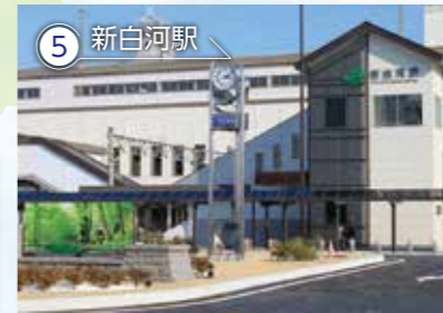
5 新白河駅 東北の玄関口・新白河駅は西郷村に位置します。新幹線が「村」に停まる場所は全国でここだけで、東京までは約80分でアクセスできます。東北新幹線と、在来線の東北本線が乗り入れており、周辺にはレンタカー店や飲食店も多数あることから、那須や会津方面への観光の要所となっています。