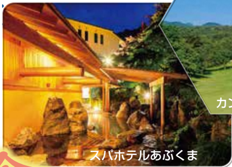
スパホテルあぶくま