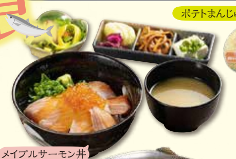
ポテトまんじゅう