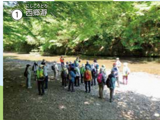
1 にしどうとろ 西郷静 村の中央を阿武隈川とその支流が貫流し、地域の随所で美しい渓谷美を形作っています。清流と岩山の景勝地「西郷静」は必見です。