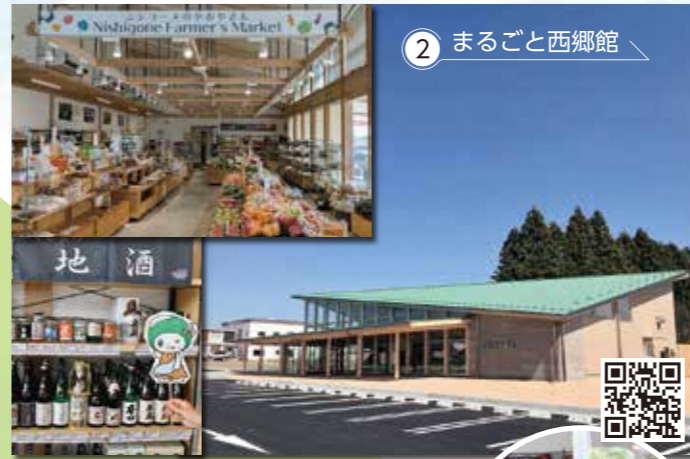
2 まるごと西郷館 西郷村を中心とした福島県南地域の新鮮な農産物をメインに、加工品・果物・惣菜・お花・お酒など多様な商品を揃えています。日本野菜ソムリエ資格保有スタッフが厳選した旬の野菜が多く並び直売所です。(野菜や果物の地方発送も承ります)