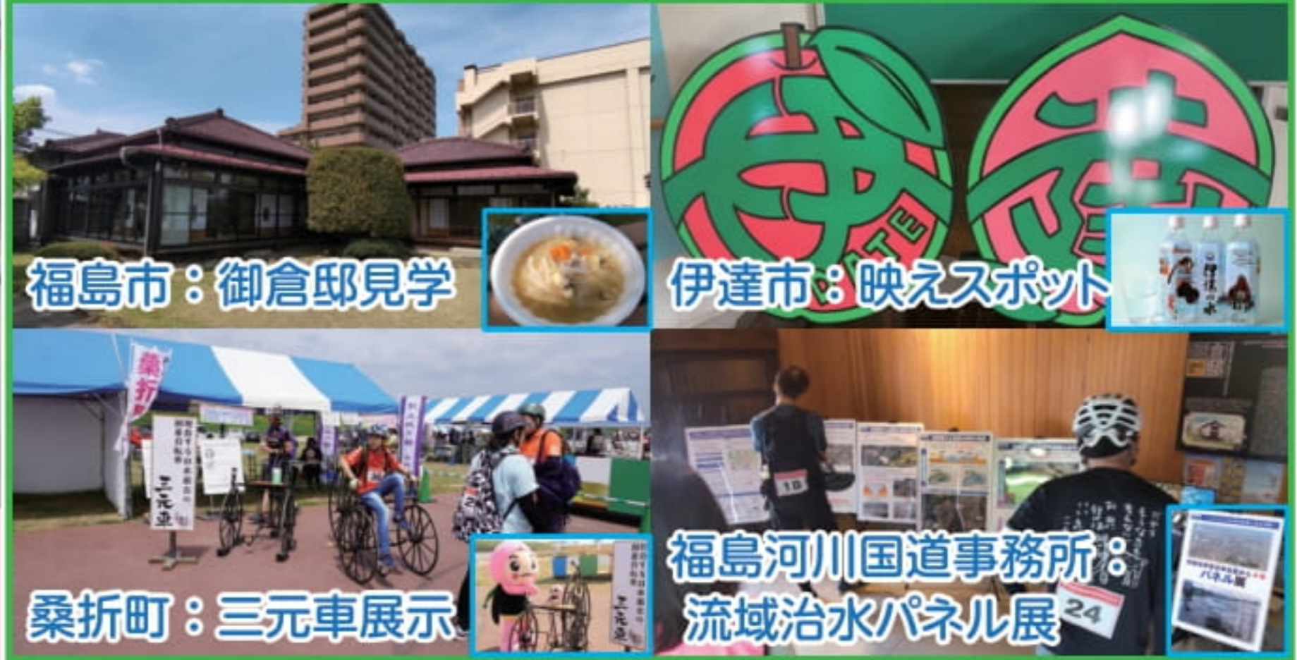
福島市：御倉邸見学